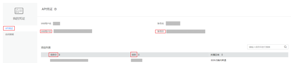
图 7-2 获取账号 ID