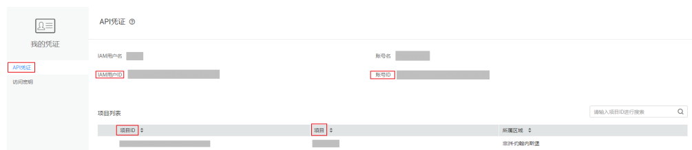
图 7-2 获取账号 ID