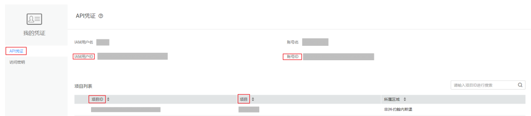
图 7-1 查看项目 ID