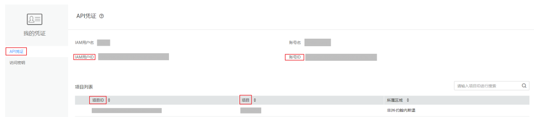
图 7-1 查看项目 ID